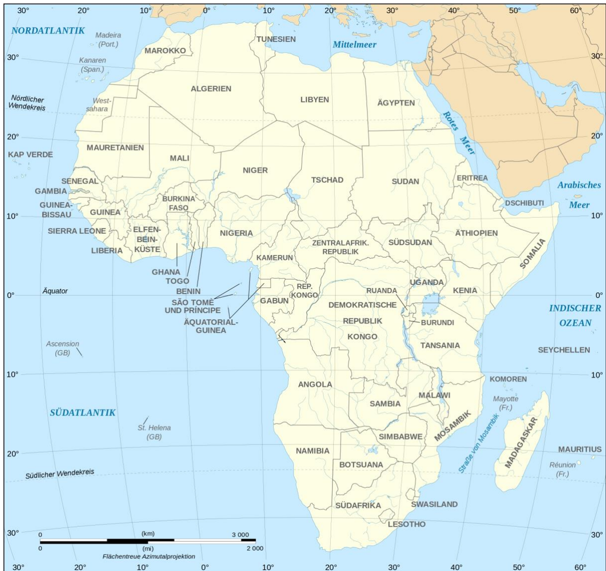
Landkarte Afrika: https://www.weltkarte.com/afrika/afrikakarten/afrika-politisch.htm . Zugriff: 10.12.19.